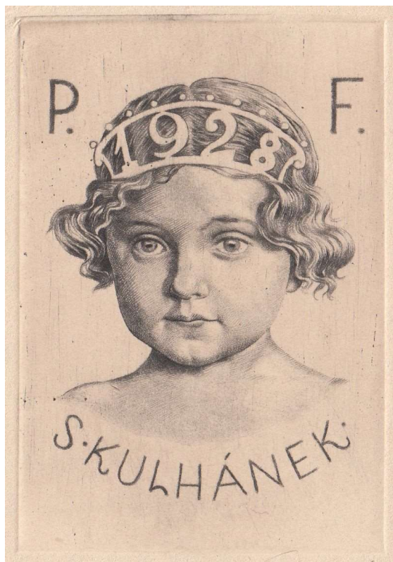
Položka 32, lept.