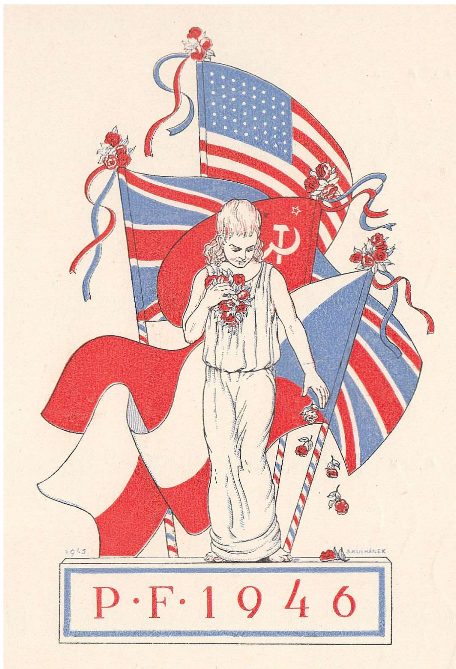
Položka 88, třibarevná zinkografie.

Na titulní straně je položka 56, třibarevná zinkografie.