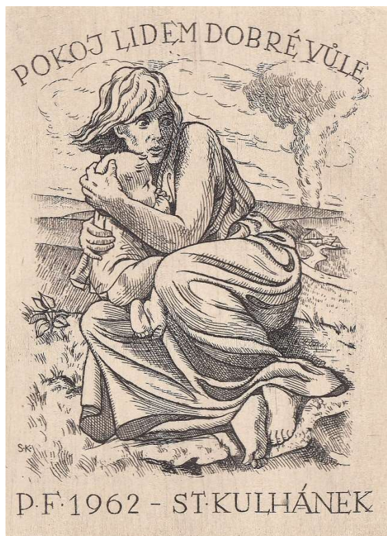
Položka 116, lept