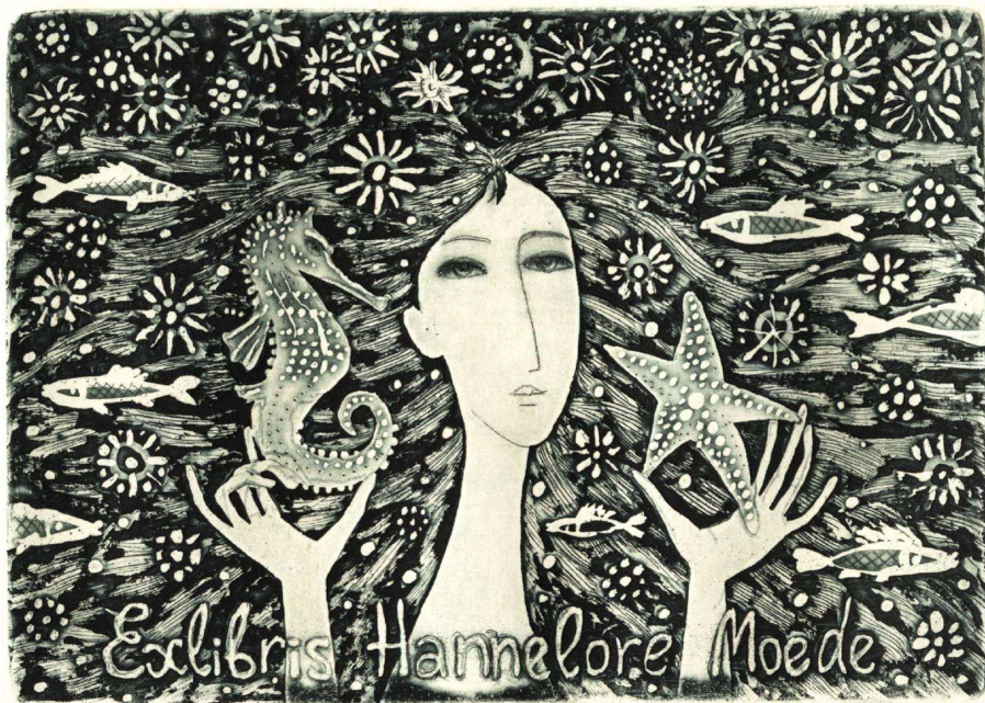
Ex libris Hannelore Moede, C3+C6, 2008