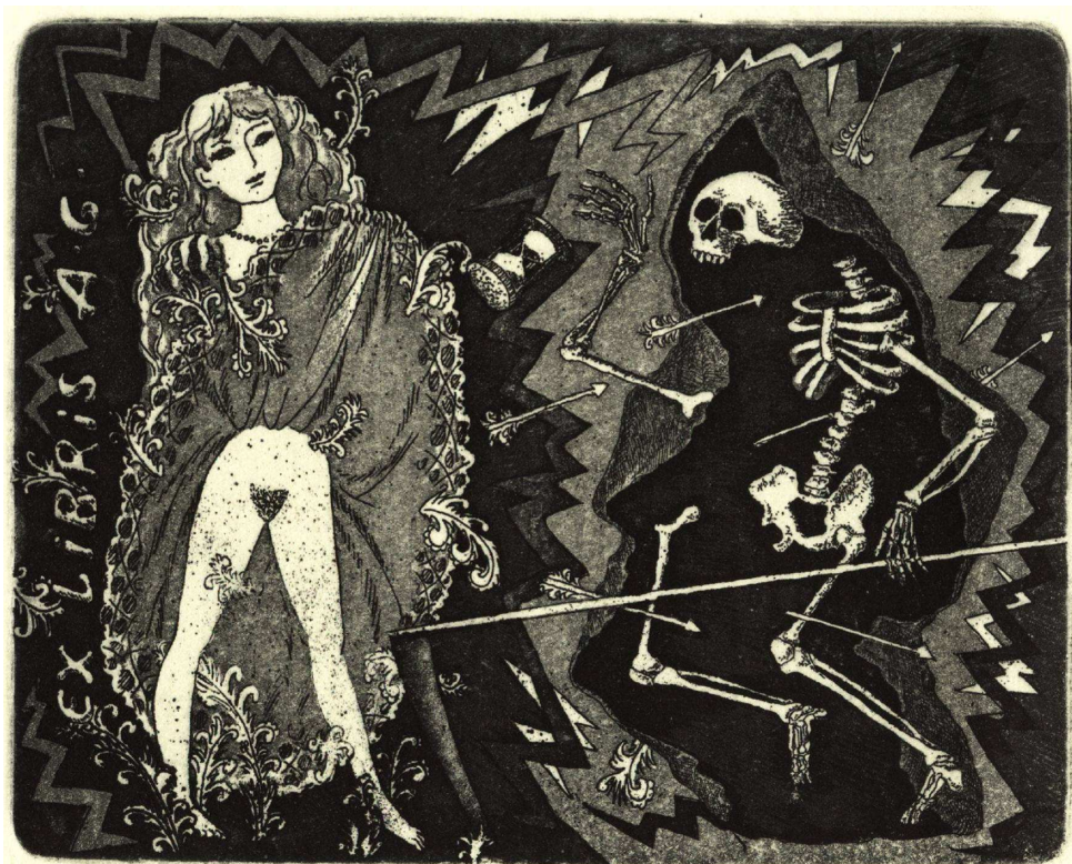
Ex libris A. G., C3+C5, 2010