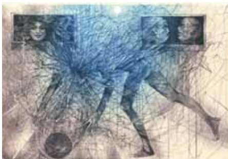
Karel Demel, C3+C5, 2016