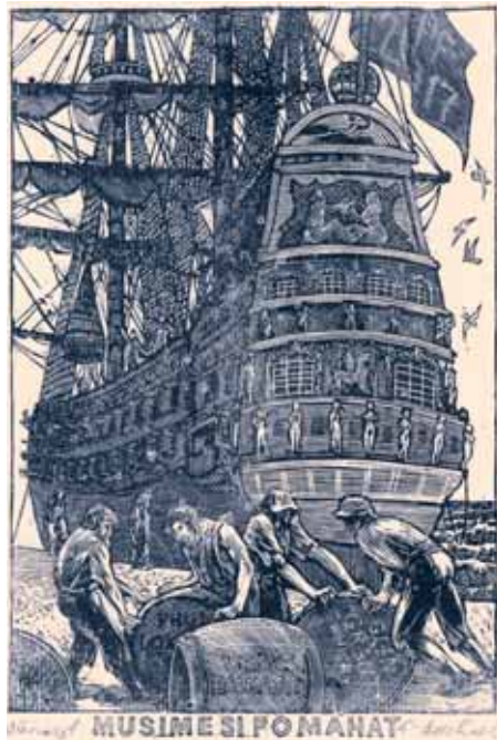
Antonín Odehnal, X2, 2016

pro svého bratra, uplynulo mnoho let a za tu dobu jich udělal téměř 300. Počet novoročenek se blíží číslu 90. Velký počet těchto drobných grafík hovoří o zájmu o jeho tvorbu. U exlibris jsou žádány zejména motivy figurální na věčné téma ženy – v její mnohotvárnosti i erotice. Rád zdopodobňuje na exlibris krajiny, poezii, sport i biblické motivy a dovedl