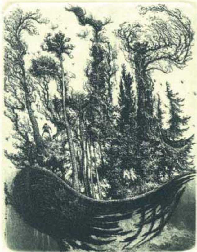
Albín Brunovský, vlastní novoročenka, C3, 1991