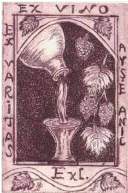
Ayşe Anil, C3+C4+C5, 2016

69 výtvarníků z 24 zemí (od nás Vlasta Matoušová) a druhý 60 výtvarníků z 16 zemí, kdy kromě nepočtených Srbů (18) se zúčastnilo jedenáct výtvarníků z Turecka a devět z Argentiny! Od nás loňská soutěž nikoho nepřilákala.