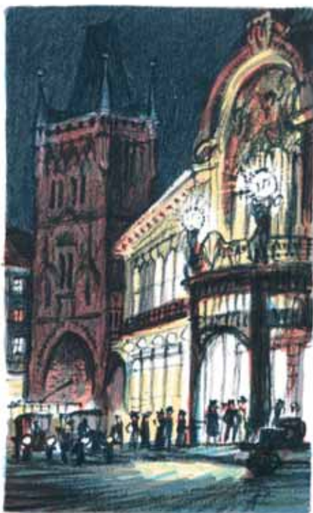
Jiří Bouda, L1, 2003

Mrzelo mě, že jsem se z časových důvodů nedostal na výměnný den v salónku restaurace Absolutum, a tak když se mi objevilo volné odpoledne v pátek 9. prosince 2016, jsem vyrazil na Adventní večer ve vzpomínkách mých přátel výtvarníků .