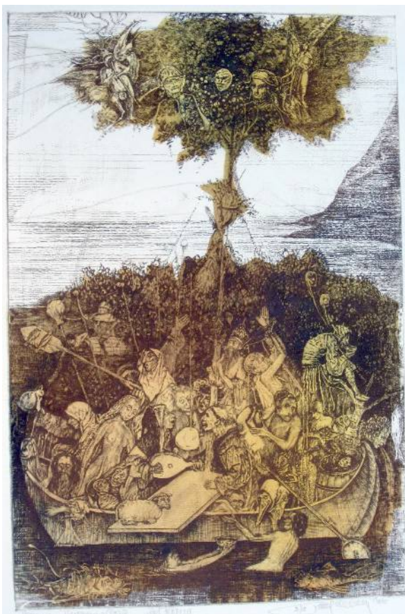
Homage H. Bosch - Lod' bláznů, 49x35 cm, 2010