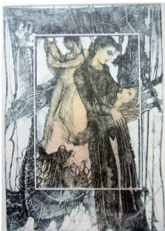
Eurydiké, 29x20 cm, 2019