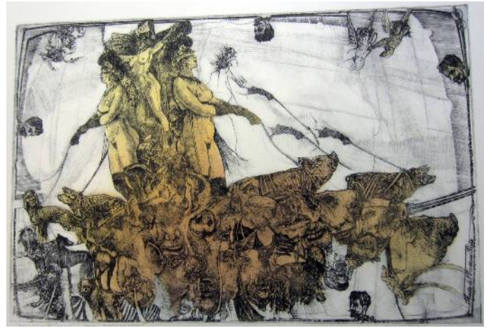
Hommage F. Rops - Pornocratés, 38x26 cm, 2014

☺ Galerii V.Wünscheho jsem zaplnil mnohokrát.