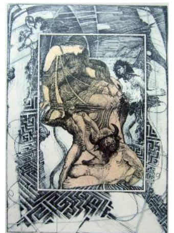
Ariadne, 29x20 cm, 2019

Sedm grafik krásných žen – bohyní – tvořících řeckou mytologii posloužilo aténskému vydavatelství Giannakos jako ilustrace knihy Řecké mytologie (bibliofilské vydání s originálními tisky).